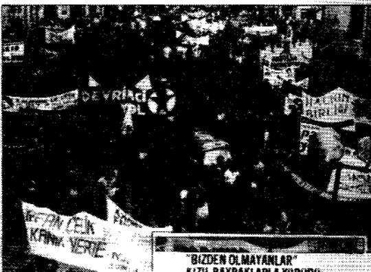
"BİZDEN OLMAYANLAR" KIZIL BAYRAKLARLA YÜRÜDÜ: Fotograf Türkiye'de yürütülen "Utanç yürüyüşü" sırasında çekildi. Fotoğraf, Türkiye'de yürütülen "Utanç yürüyüşü"nin, Türkiye'de yürütülen "Onur yürüyüşü"ne karşı bir mesajdır.